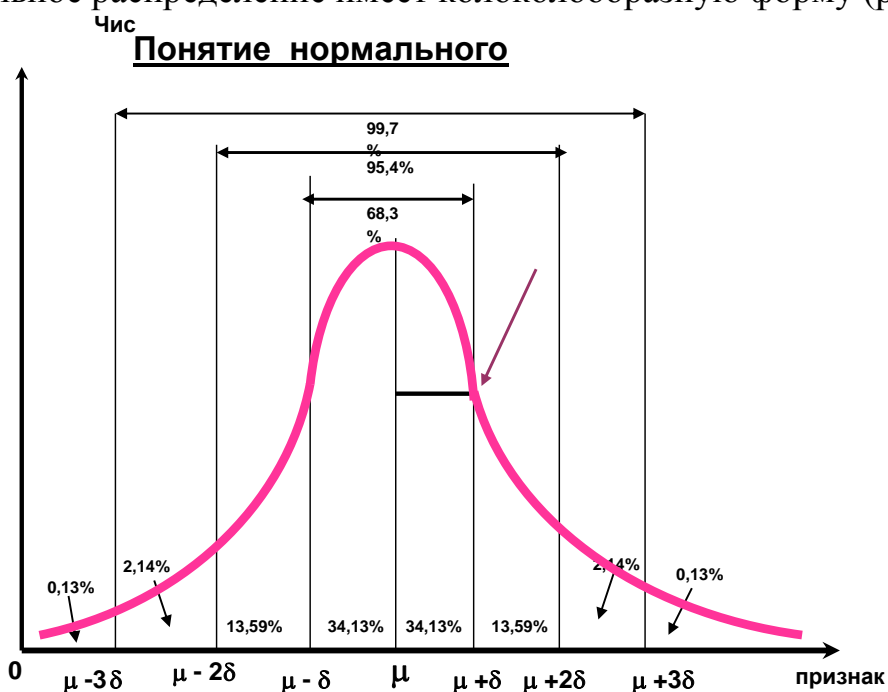
Рис. Кривая нормального распределения К.Гаусса

Нормальное распределение имеет колоколообразную форму (рис. 1).